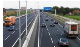
Geluidsmetingen: verwachte geluidsproductie door stille banden blijft uit

Wij hebben al eerder in de Bezem aangegeven dat het model, waarmee Rijkswaterstaat de berekeningen uitvoert, onjuiste aannamen bevat. Door het RIVM is een systematisch verschil geconstateerd tussen resultaten van berekeningen en metingen op dezelfde locaties. Hieruit blijkt dat de metingen resulteren in een 3 dB hogere waarde dan uit de berekeningen volgt.