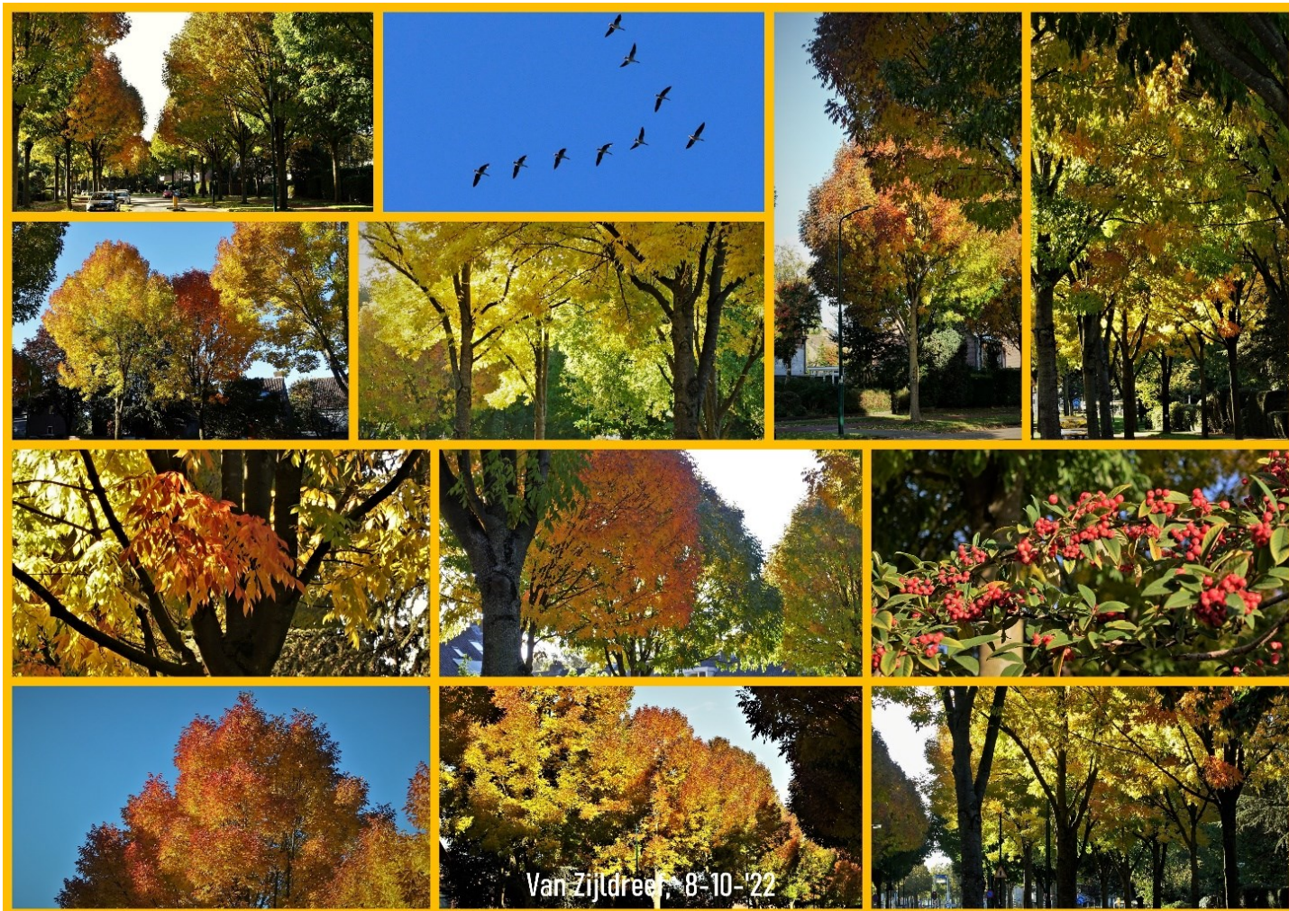
Prachtige fotocollage gemaakt door Wim van Daalen