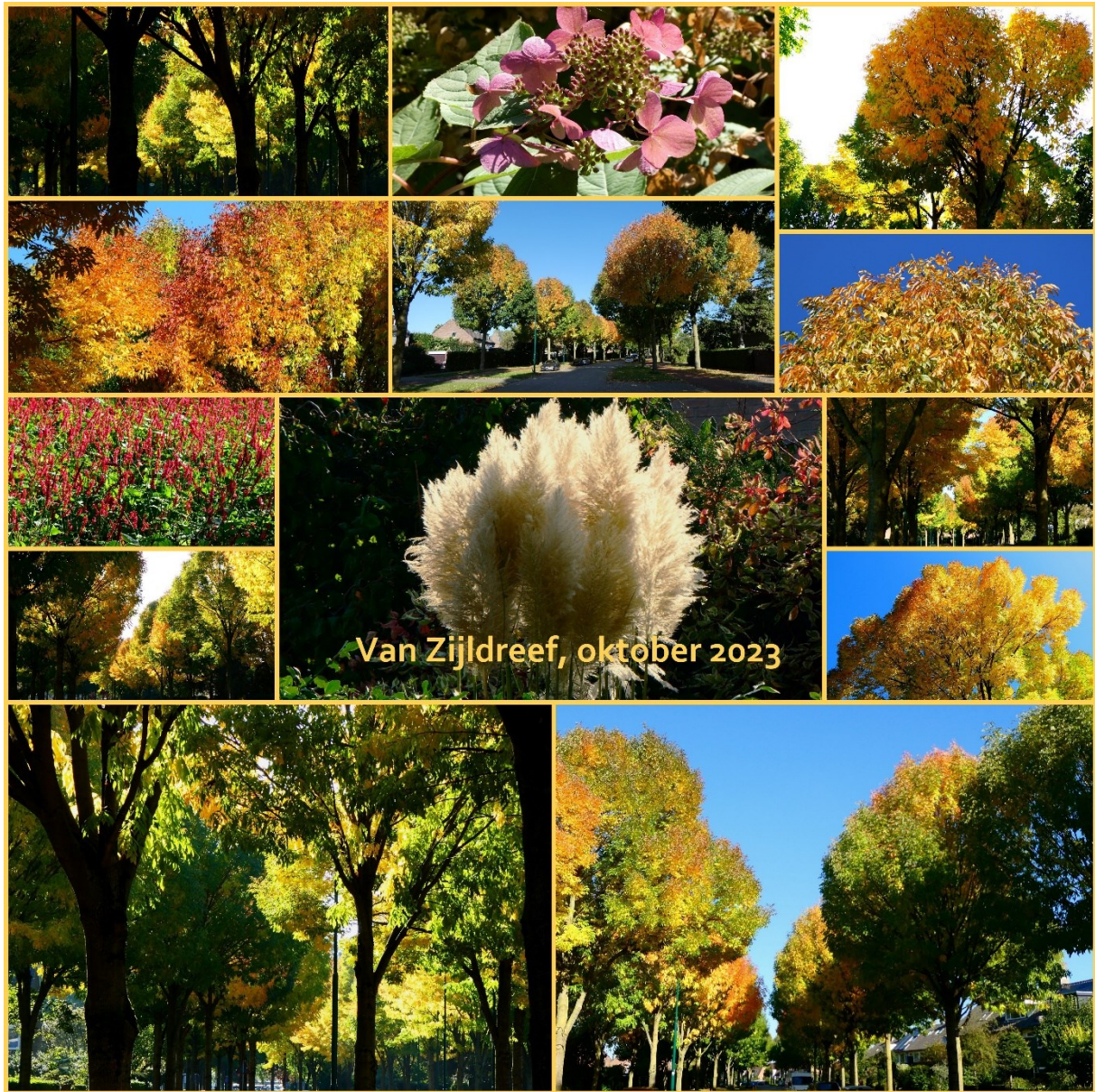
Een prachtige collage gemaakt door Wim van Daalen